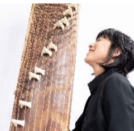
Violon / violoncelle / piano / alto / koto