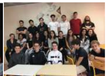
Projet avec le lycée de Taverny Arts croisés : peinture, littérature et musique

Comme pour chaque édition, un projet pédagogique sera inséré dans notre week-end. L'Institution Saint-Louis de Cabourg vient de se porter volontaire pour mener à bien ce projet qui sera mené durant l'année scolaire 2020-2021 avec une restitution (restant à définir) pendant les Journées Musicales Marcel Proust 2021).