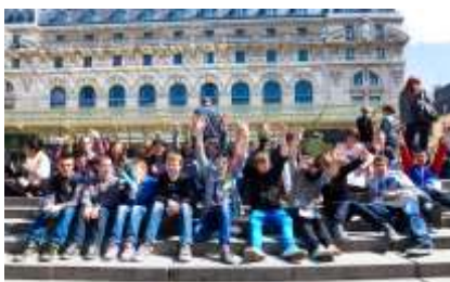
Projet avec le collège de Honfleur Carnets à la manière de Proust sur « la mer »