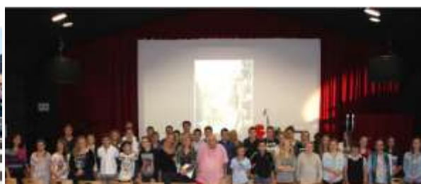
Projet avec le collège de Cabourg La première guerre mondiale et la musique